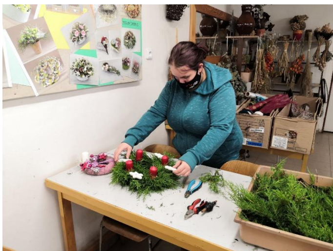
Příprava na Vánoční výstavu